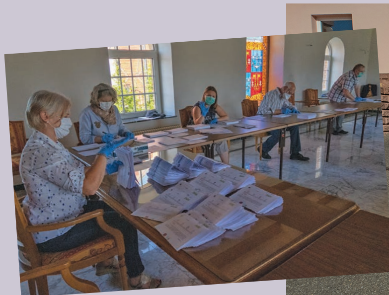
Préparation et distribution des masques et de gels aux villageois par les élus