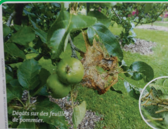
Dégâts sur des feuilles de pommier.

Les fûts de poireaux sont touchés par les chenilles.