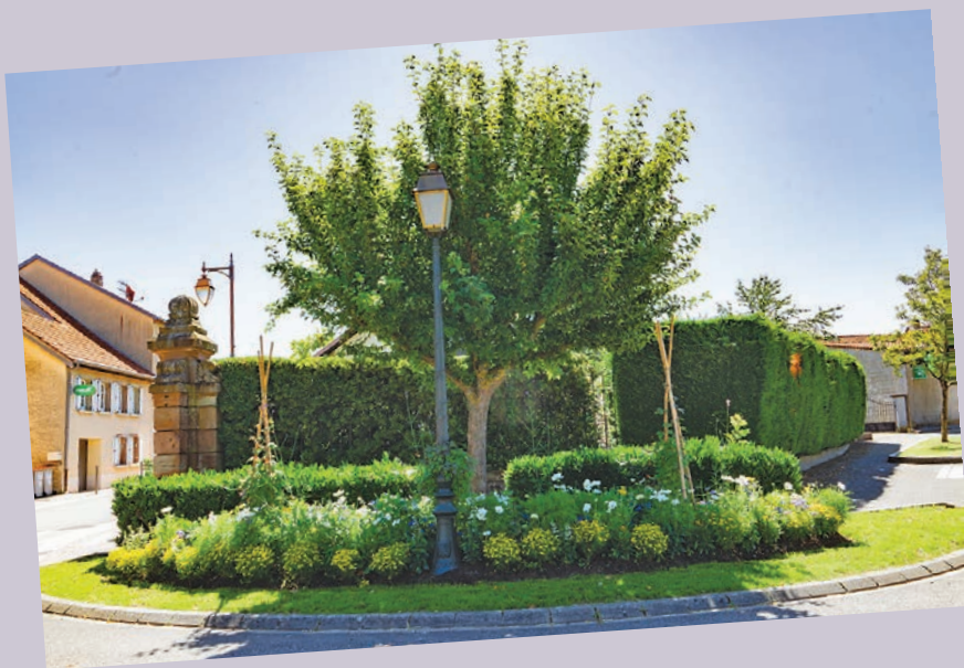
Nouveaux arrangements floraux