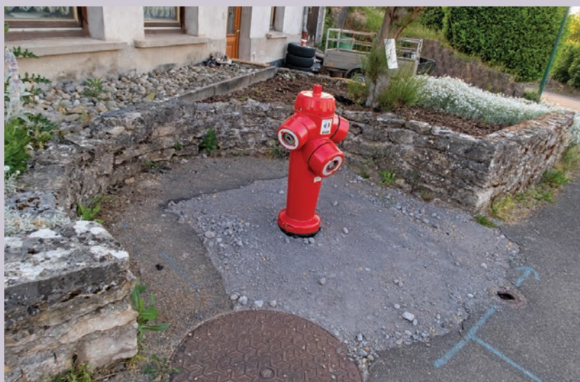
Remplacement des 3 poteaux d'incendie rue de la paix