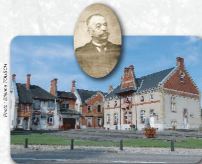
En 1982, la commune racheta le terrain et les bâtiments pour les rénover.