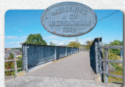
La passerelle métallique du début du XXe siècle, Zeppelinsbrücke.